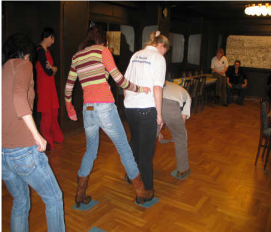
5. sz. kép