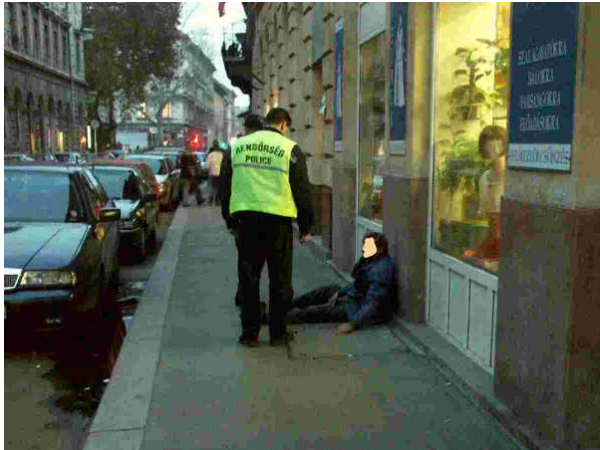
11. sz. kép

mozdulatokkal kommunikál. Ez a jelenet az adott kisvárosban mindennapos, s a közlekedők tetszéssel, megelégedéssel fogadják.