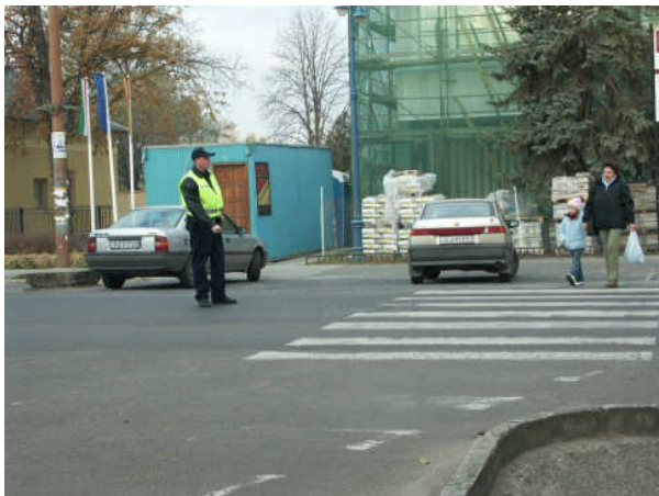
10. sz. kép

A 9. sz. képen egy bejelentés nyomán két rendőr kikérdezi az állampolgárt, akit szomszédja azzal gyanúsított, hogy leöntötte az autóját kromofággal. Mivel a férfi az előzetes információk, illetve a helyszínen meghallgatott tanúk elmondása szerint pszichiátriai kezelt, a kollégák egyike készenlétben tartja a kényszerítő eszközt, ám természetesen nem feltűnően, nehogy provokálja a személyt. Másikuk jegyzetel, mindketten figyelmesen hallgatják a beszélőt, nyugodtak, együttműködőek. Az intézkedés konfliktus nélkül zajlott.