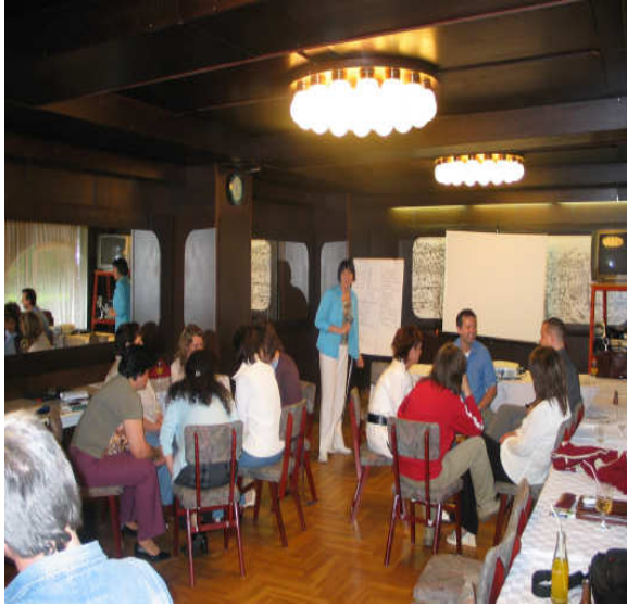
4. sz. kép