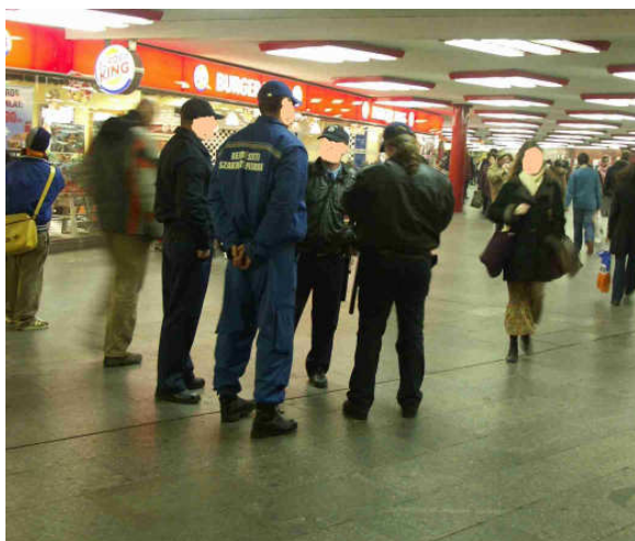
14. sz. kép

A 13. sz. képen egy tipikus közúti felvételt láthatunk: sebességmérés egy forgalmas főútvonal kisebb településről kivezető(!) szakaszán. A képen a rendőrautó, illetve a készülék elhelyezkedésére érdemes figyelni. A legszembeütőbb, hogy az érkező autók egyáltalán nem láthatják a rendőrautót, hiszen azt egy magas kerítés teljesen eltakarja, s a készüléket is csak egészen közlelről lehet észlelni. A rendőr kolléga nincs állandóan a készülék mellett, bent ül az autóban. Most épp „fogott valamit”. Amit itt látunk, az jellemző a közúti sebességmérést végző rendőrautók elhelyezkedésére. Joggal merül fel a kérdés: miért itt, a településről kivezető útszakaszon, a település végét jelző tábla előtt 100 méterrel mérnek, ahol már fokozatosan gyorsítunk, s miért nem a befelé vezető szakaszon, ahol valóban lassítani kell? A válasz egyértelmű: így garantált a statisztikai szemlélet diktálta mennyiségű bírság beszedése!