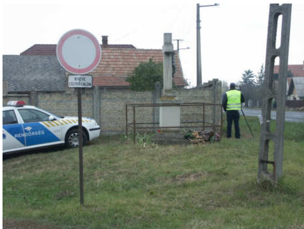
13. sz. kép

A 13. sz. képen egy tipikus közúti felvételt láthatunk: sebességmérés egy forgalmas főútvonal kisebb településről kivezető(!) szakaszán. A képen a rendőrautó, illetve a készülék elhelyezkedésére érdemes figyelni. A legszembeütőbb, hogy az érkező autók egyáltalán nem láthatják a rendőrautót, hiszen azt egy magas kerítés teljesen eltakarja, s a készüléket is csak egészen közlelről lehet észlelni. A rendőr kolléga nincs állandóan a készülék mellett, bent ül az autóban. Most épp „fogott valamit”. Amit itt látunk, az jellemző a közúti sebességmérést végző rendőrautók elhelyezkedésére. Joggal merül fel a kérdés: miért itt, a településről kivezető útszakaszon, a település végét jelző tábla előtt 100 méterrel mérnek, ahol már fokozatosan gyorsítunk, s miért nem a befelé vezető szakaszon, ahol valóban lassítani kell? A válasz egyértelmű: így garantált a statisztikai szemlélet diktálta mennyiségű bírság beszedése!