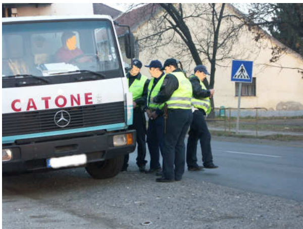
12. sz. kép

Most pedig nézzünk néhány negatív példát arra, hogy milyen „szakembereket” kapunk, ha a szociális kompetenciákat negligáljuk a képzésből.