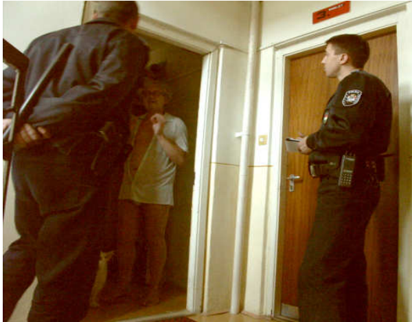
9. sz. kép

Az alábbiakban röviden, csupán néhány kép bemutatásával és elemzésével illusztráljuk, milyen rendészeti szakembereket kapunk a kompetencia alapú képzés segítségével. Milyen szakmai gondolkodás és annak nyomán viselkedés alakul ki akkor, ha a szociális kompetenciáik fejlesztését állítjuk a középpontba? Hosszasan gondolkodtunk azon, mi lenne a legalkalmasabb a szemléltetésre. Lehetett volna valamilyen konkrét, megtörtént esettel vagy általánosabb, elvontabb jelenséggel is illusztrálni, de mi szándékosan a hétköznapi jelenetek közül hoztuk a példákat, hiszen ezeken a látszólagos apróságokon múlik minden.